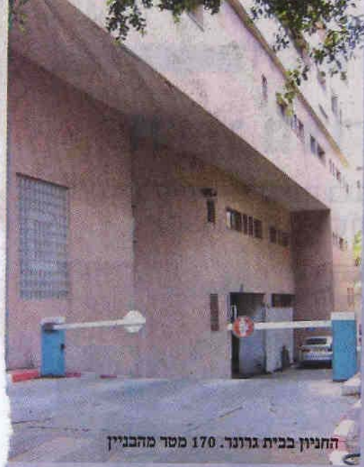
החניון בבית גרונו. 170 מטר מהכניין